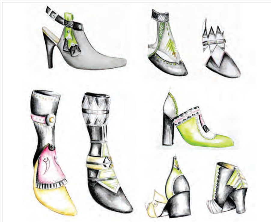
Slika 2. Idejna rješenja kolekcije ženske obuće inspirirane cifranim torbákom [5]

U idejnim rješenjima uz jarke i kontrastne kombinacije živih boja prevladavaju neutralne, siva, smeđa i bež, koje predstavljaju eleganciju i smirenost te je obuću u tim bojama moguće ukomponirati s nizom odjevnih kombinacija. Kreirani su modeli ženske obuće različiti po vrsti i namjeni; sandale, mokasine, cipele, gležnjače i čizme koji se dalje mogu razrađivati prema žanrovima, sezoni ili namjeni.