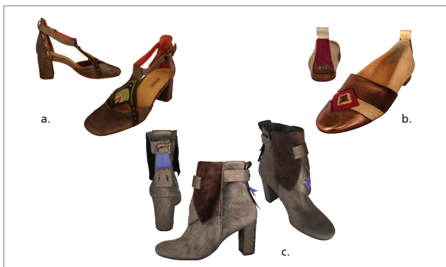
Slika 5. Izrađeni uzorci modela ženske obuće: a) sandala, b) mokasina i c) gležnjača [5]

Odabrani poticaj, cifrani torbak, nadasve je zanimljiva torba jer u svojoj izvedbi kombinacije kolorita i ukrasa odašilje poruku bogatstva hrvatske tradicije i ruketvorina. Ukrasni elementi na uzorcima modela zbog ručnog rada zahtijevaju duže vrijeme izrade pa time raste i vrijednost proizvoda. Realizirani uzorci modela ženske obuće uz dizajnerska rješenja, odabir materijala i samu konstrukciju ostvarili su postavljene inspirativne i kvalitativne zahtjeve.