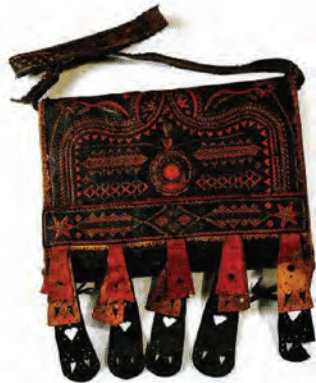
Slika 1. Muški cifrani torbák, Cerna, Slavonija, posljednja četvrtina 19. stoljeća [3]

cama, ukrasnim izrezivanjem te bušenjem. Na središnjem dijelu preklopa prišiven je okrugao motiv sastavljen od kože i stakalca ili ogledalca, a na rub viseći, raznobojni ukrasno izrezani i izbušeni komadi kože [3]. Muške kožne torbe polukružnog ili četvrtastog oblika s preklopom izrađivane su od obrađene goveđe ili teleće te svinjske ili ov-